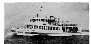
宮島航路連絡船みやじま丸

三景の1に数えられる宮島とを結ぶ国鉄所管の航路。鉄道連絡船が就航している。この航路は明治 35・4 宮島渡航株式会社が開設したものであるが、明治 36・2 山陽鉄道がこ