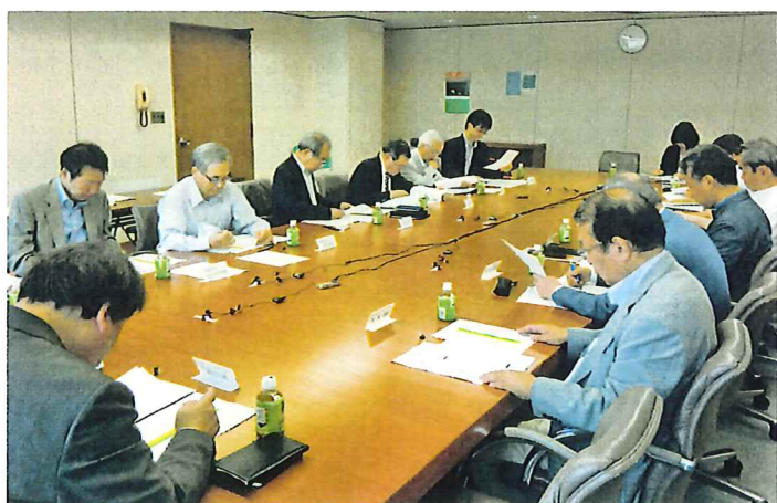
鉄道百五十年史編集委員会

以来、交通図書賞の選定・表彰、交通講演会の開催、電子図書館の運営、交通年鑑の発行、鉄道史資料の調査研究とその成果物の出版などの事業を展開してきました。そのような活動の一環として、我が国の鉄道が2022年に創業150周年を迎えることから、国土交通省、鉄道・運輸機構、JR各社、日本交通協会、民営鉄道協会等々と協力して「鉄道百五十年史」の編纂を進めています。本事業は、総事業費3億円を超える大プロジェクトであり、完成までの間、本会事業の軸と位置付けられるものです。ただ、新型コロナの感染症拡大という思わぬ事態が発生し、会合の見合わせ、図書館の利用制限などにより執筆作業全体にやや遅れを生じました。また、新型コロナ感染症が鉄道事業経営にも甚大な影響が及んだ事実を2022年に至るまで克明に記述する必要があることから、刊行時期を新たに2023年とし、鋭意取り組んでおります。