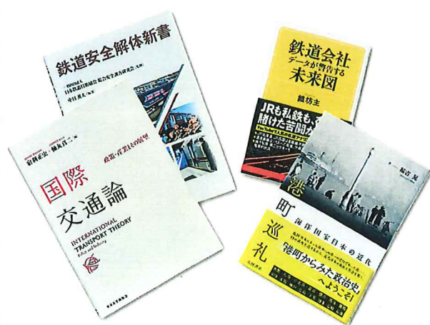
交通図書賞受賞図書（2022年度）