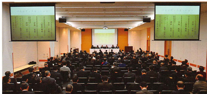
交通シンポジウム

いまだに未解明の分野が数多く残されている戦後の鉄道史を中心に、基礎資料の収集と調査を進め、資料目録の作成、入手困難資料の復刻、旧国鉄幹部や実務家を対象とするオーラルヒストリーなどの事業を進めています。