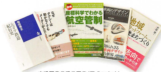
交通図書賞受賞図書（平成26年度）