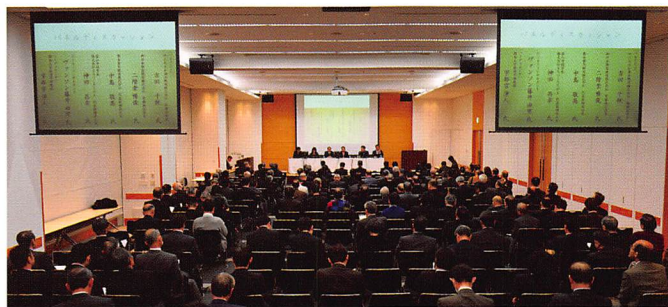
交通シンポジウム

いまだに未解明の分野が数多く残されている戦後の鉄道史を中心に、基礎資料の収集と調査を進め、資料目録の作成、入手困難資料の復刻、旧国鉄幹部や実務家を対象とするオーラルヒストリーなどの事業を進めています。