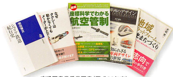
交通図書賞受賞図書（平成26年度）